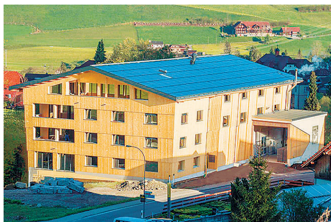
Die integrierte Solaranlage mit Firstkönig veredelt den modernen Bau und gibt dem Gebäude zusätzlichen Charakter.

Statt auf Fördergelder zu warten, wollen Hofstetters ein klares Zeichen setzen. Für das Image der gesunden und biologischen Schafmilch kommt nur der Einsatz von 100% erneuerbarer Energie in Frage: Die Wärme wird von einer Schnitzelheizung bereitgestellt, ergänzt mit Sonnenkollektoren und zwei grossen Wärmespeichern für Brauchwasser und Prozesswärme. Die Kühlleistung für die Milchlagerung wird von 5 Kondensatoren bereitgestellt. Die entstehende Abwärme wird durch die Wärmetauscher in die Wärmespeicher zurückgewonnen. Ebenfalls wird die Raumwärme auf diese Weise zum Aufwärmen der Zuluft wiederverwendet. In Zusammenhang mit der Elektrizität wurde ein 140 kWh Eisswasserspeicher verbaut. Dieser kann überschüssiger Strom über die Kompressoren in Kälte umwandeln. Diese enorme Speicherkapazität kann im wahrsten Sinne als kleiner Stausee im Haus betitelt werden. Für die Konzipierung und Einbindung der Elektrizität hat sich die Emscha GmbH auf ihren Energiearchitekten und Solarpartner Alectron solar aus Ruswil festgelegt. Als Energiearchitekt und Fachplaner projiziert, entwickelt und baut Alectron Solargeneratoren, Speicher und Heizungssysteme