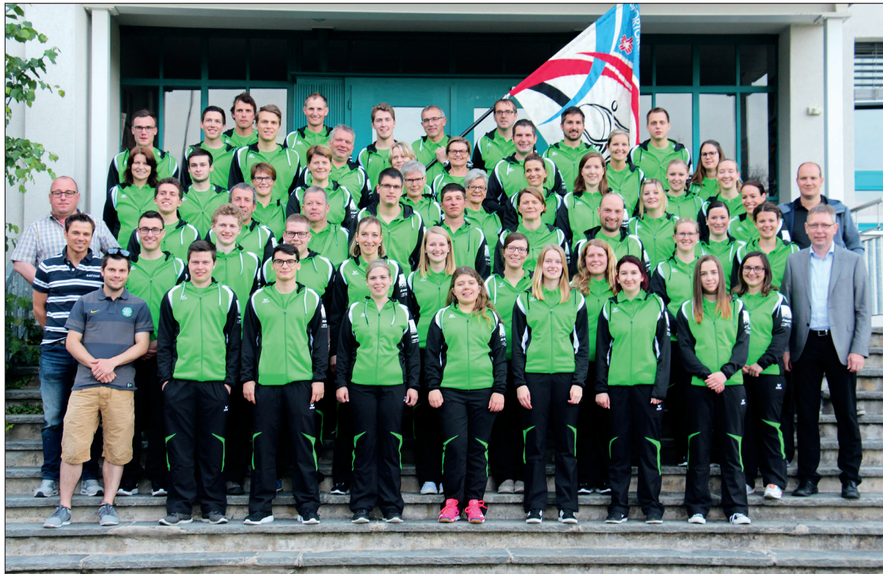
Die Sportgruppe Schlierbach präsentiert zusammen mit den Sponsoren das neue Vereins-Outfit.

Der Jugendsporttag ist einer dieser Events, wo Alt und Jung zusammenkommen. Sportliche Leistungen gepaart mit Spiel und Spass stehen im Fokus. An diesem nicht obligatorischen Wettbewerb nehmen die Schulkinder der Primarschule, auch jene welche nicht regelmässig in einer der Riegen aktiv sind, fast ausnahmslos und mit grosser Begeisterung teil. Neben den klassischen Wettläufen, Kind gegen Kind, gibt es altersgemischte Gruppen, die um ein möglichst gutes Ergebnis kämpfen. Bei den neun verschiedenen Posten ist Teamgeist genauso wichtig wie sportliche Leistung und die grosszügig bemessenen Preise reichen für al-